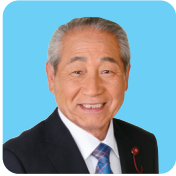
神戸市会議員 池田りんたろう